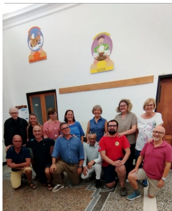
La nuova Equipe del Settore D